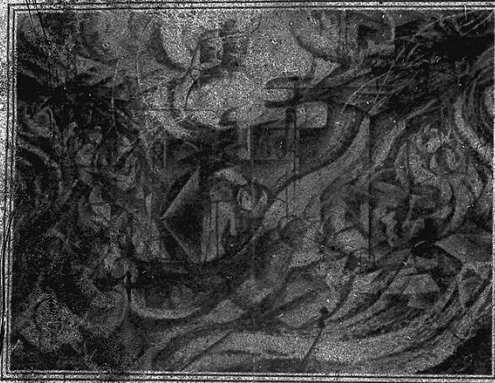
LES ANGES DE MOUSSE

Le mouvement de l'avenir se profile, se peinture d'abord à nos