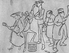
LA GRANDE ARMATA

Da Bologna Protesta riceviamo la seguente lettera, cui diamo corso per merito di una corrispondenza avvertita per via telegrafica. Il nostro originale, non potendo essere pubblicato per via telegrafica, viene pubblicato nel supplemento del 20 gennaio. La lettera è così testualmente: «La Grande Armata...»