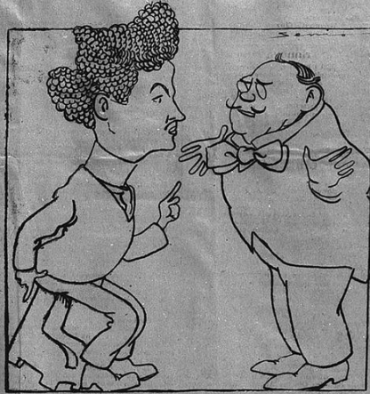
Il pittore — ... E la sedia entra in noi. Comprendo? Del Carretto — Altro che! Mi è accaduto lo stesso col... seggio senatoriale!

I nostri oggi entrano nei divani, su cui si siedono, ed i divani entrano in noi. Manifesto celebre.