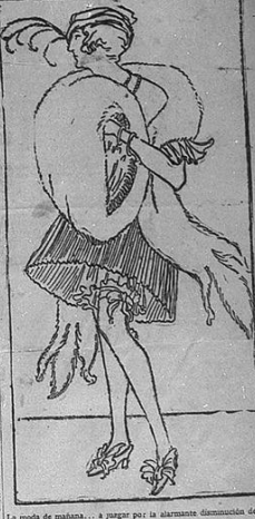
Le mode de mañana... à payer par la alarmante diminution de ceux qui exigent les modes de día.