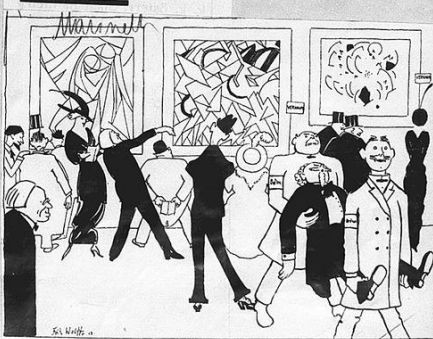
Die Eröffnung des 'Arbeitsplatz' in Berlin (Anschätzung der Zuschauer, Kunden und Beschäftigten)