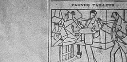
Pauvre-vous penser à ma petite note? Amortissez ça à un de ces jours, pour le coup... Je suis futuriste.