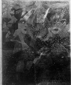
SEVERINI, danseuse obsédante