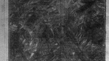
Carri — Pénétrables de l'émancipation-futuriste

Ces dessinateurs ajoutent: « Nous déplorons que les critiques d'art sont inutiles ou hostiles ».