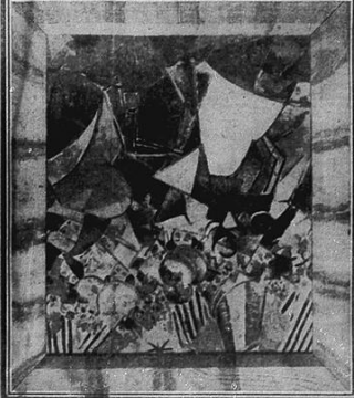
This "painting" (the title was found) is supposed to represent a sensation of travelling. It is a water-colour. Done in London in a few hours there is a most extraordinary one. In order to show that it doesn't matter we have had one of these photographs taken with the other two. If you think them the other way you can have the prints made to suit their best effect. It can be said that there is a certain beauty, and it is the only one that is not a photograph of a photograph.

Menu. Consommé Payzanne Coteau Vert Frit Escalope de Turbot Jovinelle Moussé de Langue au Coteau Sole de Montan Marahibre Pommes Frites Faisan en Casserole Salade Bonne Claire Finesherbe Fraisises Dessert et Café