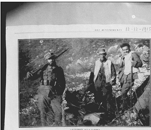
I FUTURISTI ALLA GUERRA F. T. MARINETTI E U. BOCCELLI, SALLE POSIZIONI DI BOSSO CASANA

qualcuna, avvicinato, colmo e impastato come sabbia, per stabilire la posizione. Il ricordo del generale Cantore non si cancella mai dalla mente dei futuristi. Cantore era un uomo di grande statura, di una forza di volontà che non ammetteva sconfitte. Egli aveva saputo comandare l'armata italiana in una delle più difficili campagne della guerra, quella del fronte del Nord. Cantore era un uomo di grande statura, di una forza di volontà che non ammetteva sconfitte. Egli aveva saputo comandare l'armata italiana in una delle più difficili campagne della guerra, quella del fronte del Nord.