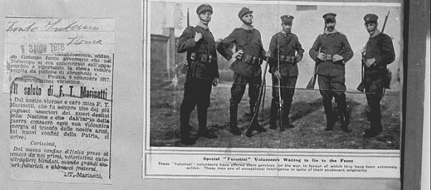
Special "Futurist" Volunteers Waiting to Go to the Front