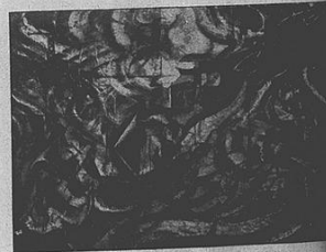
Boccioni: Sjælstilstande: De, der siger Farvel.

Fra Italien slynger vi dette Manifest ud over hele Verden. Vi vil befri Italien for det stinkende Kræftskade af Professorer, Arkæologer og Ciceroner. Allfor længe har Ita-