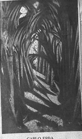
CARLO ERBA Invenzione ritmica d'un interno di cattedrale.