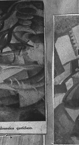
Margherita G. Sarfatti