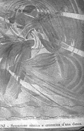
ACHILLE FUNI - Sessione ritmica e cronometrica d'una danza.