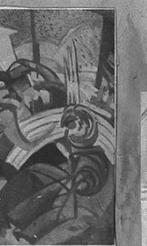
ACHILLE FUNI - Donna, macchina, cane.