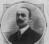
Il fondatore di Zanna , il signor... (caption text partially obscured)