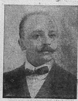
F. T. MARINETTI

Le poète futuriste, qui a écrit ce poème. C'est l'œuvre de F. T. Marinetti, le poète futuriste, qui a écrit ce poème. C'est l'œuvre de F. T. Marinetti, le poète futuriste, qui a écrit ce poème.