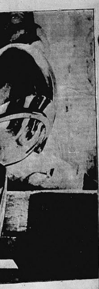
CONSTANTIN BRANCUȘ: CAP