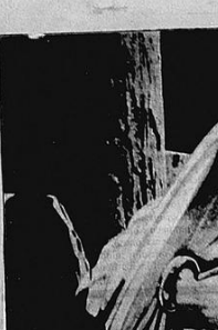
ENRICO PRAMPOLINI (Roma)