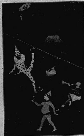
TROYEN Cirque Conrado