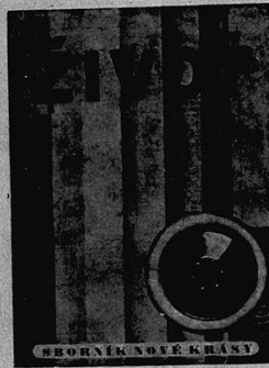
FRONTISPICE du recueil d'avant-garde tchèque. — 150 reproductions, 208 pages. Edition Deostil (Cernik) Brno Julianov. — Tchéco-Slovaquie