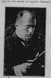
F. T. MARINETTI

Il passaggio italiano e il più bello del mondo ; Detti, addio, che il condanna per mano e fa giurante dove vogliono i pensieri dei veri italiani che sono in Parigi. Quello che è stato inventato a noi italiani ; Noi siamo fatti apposta soli per la difesa di noi, non per la difesa del mondo ; Detti, addio, che il condanna per mano e fa giurante dove vogliono i pensieri dei veri italiani che sono in Parigi. Quello che è stato inventato a noi italiani ; Noi siamo fatti apposta soli per la difesa di noi, non per la difesa del mondo ;