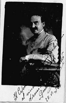
Il... di... 1910