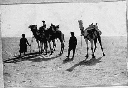
Un'ala di indurati esploratori.