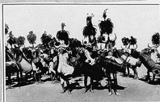
THE PICTURESQUE SIDE OF INDIAN SPORT: MOORHAMS IN GARA KIT FOR VILLAGE DANCES—MEN WHO ACCOMPANIED SIR MONTAGU BUTLER AS MESSENGERS. These men of the Moorah tribe accompanied Sir Montagu Butler, Governor of the Central Province, during a short sojourn in one of the Federated States. They are seen here engaged in their special dance which they dedicated to the honor of their visiting guests. These people carry bows and arrows with which they kill deer for food. They also attack tigers and panthers. One of the latter animals by the name of a Moorah's lion was brought into the camp the day after the Governor and his party left.