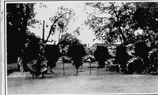
AT SIR MONTAGU BUTLER'S SHOOT IN A FEDERATORY STATE OF THE CENTRAL PROVINCES OF INDIA. PART OF A RECORD SHOT. A tiger came out in each of the three matches on the first day of the week. On the following days six more were shot, three of which were record successes. These pictures were shot with a movie camera which was set up in a grove of trees and three pictures, of which two are reproduced in the following page. This was thought to be a record for the Central Province in the time.