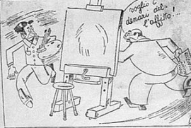
A Capri Marinetti ha inaugurato una mostra di pittura circumvisionista. Ecco l'origine di questa nuova tendenza.