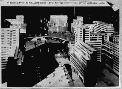
(C. Deasoni). Proietto di MM. Amedeo Venturi e Henri Sauvage avec autobus et vains serviettes pour le p...