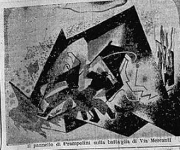
Il palazzo di Frampolini sulla battigia di Via Mercanti