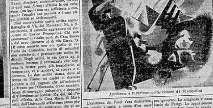
Andrieno e futurismo nella visione di Frampolini