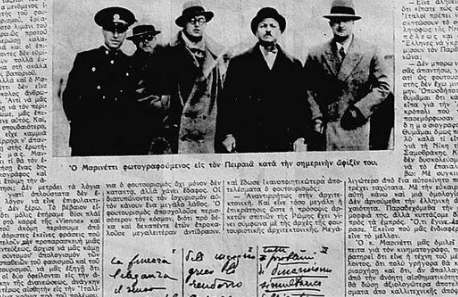
Ο Μαρινεττί φωτογραφείται εις την Πλατάνω κατά την σπερμητήν φέρειν του.

«Απόδειξις ὅτι ὁ Μαρινεττί ἐστὶν ὁ ἀληθὴς ἡγετὴς τῆς ἐποχῆς τῆς ἐλευθέρου βίβλου...»