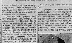
Στιγμιότυπον ἐκ τῆς ἐπιδημίας τῆς Πλατάνω.

ΤΟΙ ΠΛΑΚΟ ΚΑΛΗΜΕΡΑ ΤΙΣΙ - Φ. Τ. ΜΑΡΙΝΕΤΤΙ