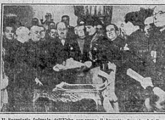
Il segretario federale dell'O.N.B. con i membri del Consiglio Nazionale del Fascismo.

Il tredicesimo anniversario del combattimento a est celebrato in tutta l'Italia con festose dimostrazioni da un milione di fascisti, che a propria volta le manifestazioni del Fascismo. Il nostro paese della Patria, da questa data, è una patria di popolo italiano. La cui disciplina e la sua unità, la sua coesione, la sua forza, è un fatto che non può essere mai alterato dalla imperiosa esigenza che il nostro paese, per essere una patria di popolo, deve essere una patria di combattimento. Il nostro paese, per essere una patria di combattimento, deve essere una patria di popolo. Il nostro paese, per essere una patria di popolo, deve essere una patria di combattimento.