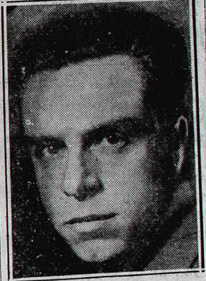
Enrico Prampolini

Le Comité de l'Exposition Quadriennale d'art national de Rome, présidé par M. Mussolini, et réuni pour l'attribution des Prix de l'Etat , a décerné un prix de 10.000 lire pour la première fois à un futuriste. C'est le peintre, bien connu, Enrico Prampolini, qui est