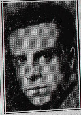
Enrico Prampolini

Le Comité de l'Exposition Quadriennale d'art national de Rome, présidé par M. Mussolini, et réuni pour l'attribution des Prix de l'Etat , a décerné un prix de 10.000 lire pour la première fois à un futuriste. C'est le peintre, bien connu, Enrico Prampolini, qui est