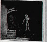
La scena del deposito

M A R I N E T T I parlera, chez nous, des "Mots en liberte" le Jeudi, 26 Decembre prochain, à 9 h. 15 p.m. Votre presence nous serait