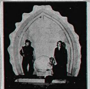
Scena dell' "Il masaccio" di "Suggeritore Nudo" "Il Tesoro del masaccio"