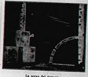
La scena del deposito

شاعر إيطاليا عصير في القاهرة مؤثر اجابة الادوية معلقا في الشهور من بين طيور ايطاليا لكثير من اهل مصر والاشيخ عاتق لبنان ايطاليا في مؤثر اجابة الادوية لجميع هذه في القاهرة في يوم 23 ديسمبر الاجري وما يستحق الذكر منه انه ولد في لاسكندرية حيث اقام والده حتى بلغ لثامنة عشرة من عمره وادام في كرمه لايطاليا بعد خلعه ملكة العاهل في مؤثر القائمين في طيور ايطاليا عام 1920 وكان السيور مولودين اول القديسين في اذنيه عبروا في الايام الايام في مصر لاشيخاه وتمت ايامه الايام في مصر لاشيخاه نار: وقد عاش انه سقى اياه وجوده في القاهرة مع عشرين اية اربعة