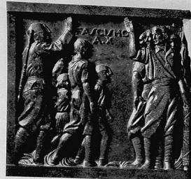
bas-relief de Maraini.

L'exposition organisée par Léon Marseille permettra d'apprécier la persistance des qualités plastiques en honneur aux grandes époques, chez des artistes jeunes, sollicités par les tendances nouvelles, et impatientes de s'exprimer dans un langage personnel et concret.