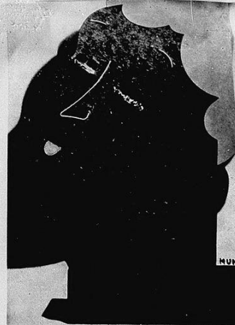
MUNARI: Plastico polimerico per profumo