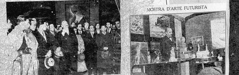
MOSTRA D'ARTE FUTURISTA