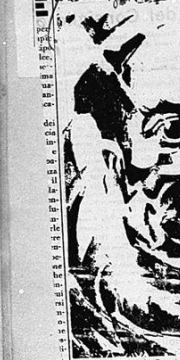
Ritratto vulcanico di S. E. Marinetti