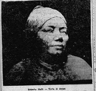
Roberto Melli - Testa di donna