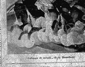
Gruppo di cavalli - Alpa Bruschetti