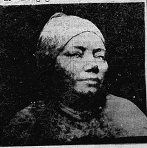
Roberto Nelli - Testa di donna