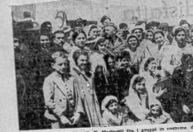
LITTORIA - 8. E. Marinetti fra i gruppi in costume della Provincia

GIORNALE D'ITALIA - ROMA 21 MAG 1936 (Edizioni di Provincia)