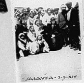
ALABIA - 3-9-XIV