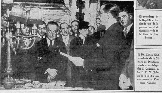
El presidente de la República haciendo uso de la palabra en el almuerzo servido en la casa de Gobierno

El presidente de la República, don Justo, recibió a los delegados del Congreso de los P. E. N. Clubs en la casa de la cultura, ofreciéndoles un almuerzo. Este acto fue muy significativo y permitió a los congresistas cambiar impresiones con el general Justo. Los discursos fueron muy aplaudidos por los congresistas.