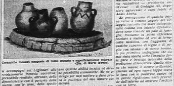
Macina primitiva e porcellane ceramiche.

Un'idea di un'epoca preistorica, un'epoca di cui si parla molto, ma di cui si sa poco. Si parla di macina primitiva, di porcellane ceramiche, di un'epoca di cui si parla molto, ma di cui si sa poco. Si parla di macina primitiva, di porcellane ceramiche, di un'epoca di cui si parla molto, ma di cui si sa poco.