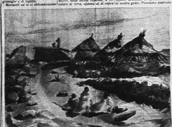
Un'idea di un'epoca preistorica, un'epoca di cui si parla molto, ma di cui si sa poco.

Un'idea di un'epoca preistorica, un'epoca di cui si parla molto, ma di cui si sa poco. Si parla di macina primitiva, di porcellane ceramiche, di un'epoca di cui si parla molto, ma di cui si sa poco. Si parla di macina primitiva, di porcellane ceramiche, di un'epoca di cui si parla molto, ma di cui si sa poco.