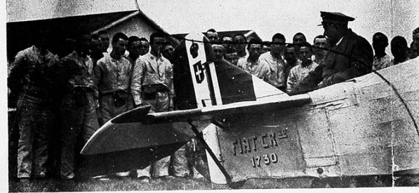
Lezioni teoriche e pratiche sui diversi tipi di ap- parecchi