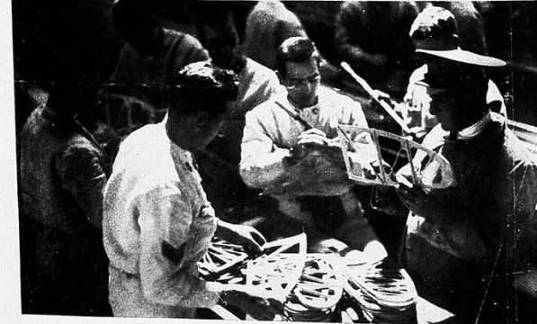
I radio telegrafisti apprendo- no i segreti della ra- dio per tessere nell'aria una invisi- bile rete che colle- gherà alla terra le poterose macchine aeree. Istruzioni di allievi montatori.

Mentre nell'Africa Orientale l'Aviazione, come l'Esercito, sta scrivendo pagine di imperitura gloria, in Patria si forgiavano nuove ali e nuove aquile.