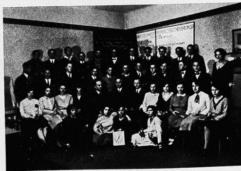
Esperantokurso en la metiaj klerigaj lernejoj en Linz a. D., Aŭstrujo.