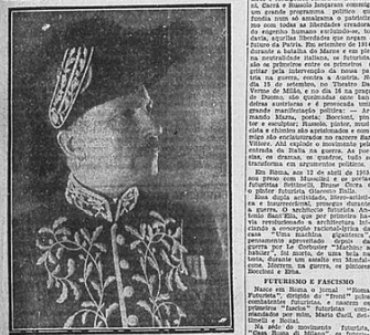
Passarinho de Ypiranga

Como sempre acontece a Italia e a Europa, o futurismo nasceu em Paris, no ano de 1909, quando Marinetti publicou o seu manifesto "Manifesto do Futurismo" no "Correio Paulistano".