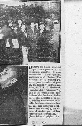
El escritor y poeta Marinetti en Buenos Aires