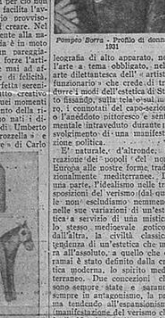
Carlo Carra - La corazzata - 1958

che ininterrottano il consenso della pittura, ancora una volta in grado di rinnovarsi nelle nuove idee dell'arte moderna, con quelle di rinascita sociale che sono alla base della Rivoluzione fascista. La mostra tradizionale che si sempre stata di avanguardia, deve essere oggi un'arte che sappia coniugare il passato e il presente, il vecchio e il nuovo, il classico e il moderno, il figurativo e l'astratto, il concreto e l'ideale, il materiale e lo spirituale, il fisico e il metafisico, il sensibile e l'insensibile, il finito e l'infinito, il finito e l'infinito, il finito e l'infinito, il finito e l'infinito.