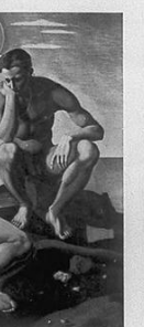
Mario Tozzi: "Adamo ed Eva" (Affresco) Pilla: "Dionisi" (Museo di Grenoble)

La Scuola di Milano, che ha saputo tenerne conto di quella cultura, ma non per ciò ha indifferente, che faccia l'opera che permette di creare.