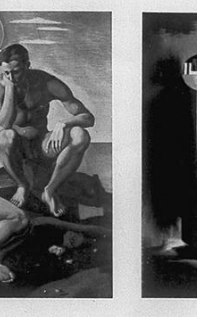
Mario Tozzi: "Adamo ed Eva" (Affresco); Pillini: "Dionisi" (Museo di Grenoble)

La mostra di Milano, in una galleria di via Broletto, ha aperto una rassegna di opere di artisti milanesi, di cui si è parlato in una nota precedente. La mostra, che si svolge dal 28 settembre al 4 ottobre, è curata da Achille Funi e ha come titolo "La pittura nella scuola moderna di Milano".