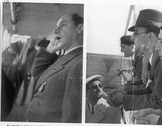
Il Duce alla Milizia Forestale. In alto: il Duce alla Milizia Forestale. In basso: il Duce alla Milizia Forestale.