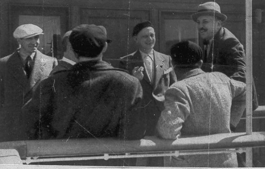
Il Duce alla Milizia Forestale. In alto: il Duce alla Milizia Forestale. In basso: il Duce alla Milizia Forestale.

Niente e qualche cosa Stella detta del club, legge la lista dei soci. Stella detta del club, legge la lista dei soci. Stella detta del club, legge la lista dei soci.